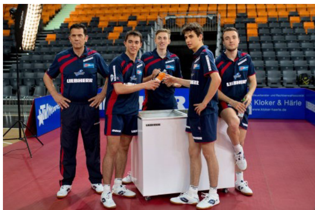
Foto: Die TTF Liebherr Ochsenhausen möchte eine gute Rolle in der TTBL spielen

Zusammen mit einem Wirtschaftsprüfungsunternehmen hat sich die TTBL Sport GmbH mit den Lizenzanträgen befasst und die Voraussetzungen der Vereine hinsichtlich der rechtlichen, personellen, administrativen, infra-strukturellen und finanziellen Kriterien geprüft. Auf dieser Grundlage erfolgte die Lizenzvergabe durch den Aufsichtsrat der TTBL Sport GmbH.