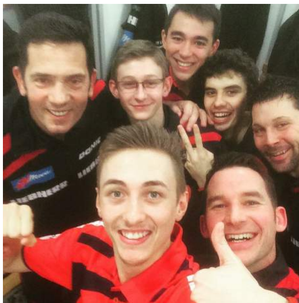
Die Freude beim Team des TTF ist groß