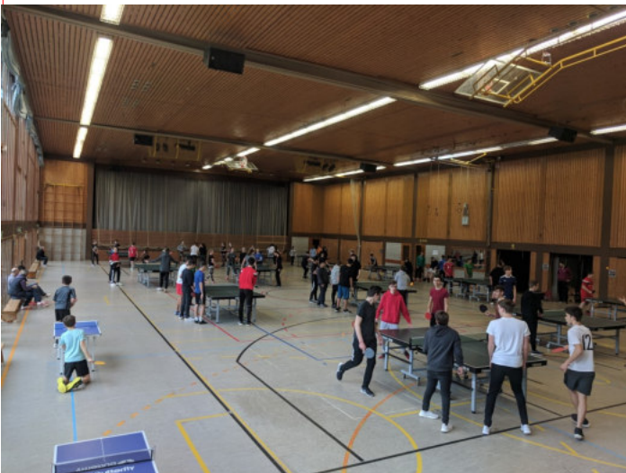
Links im Bild die gefüllte Halle beim TTVWH On-Tour Event in Ailingen

Ein besonderer Dank gilt den Sportlehrern der Realschule Ailingen, die als Organisatoren und Aufsicht fungierten, sowie den Helfern des TSG Ailingen für die tatkräftige Unterstützung des Programms.