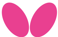
TABLE TENNIS FOR YOU 卓球をあなたへ