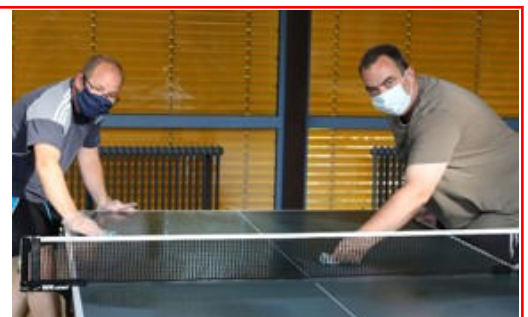
Neue Normalität: Tische desinfizieren mit Handschuhen und Maske, hier beim TTC Dillhausen/Barig-Selbenhausen.

Um dorthin zu gelangen, klicken Sie hier.