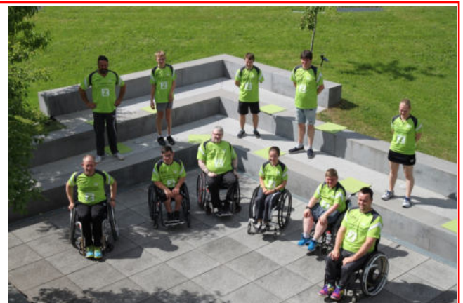
Corona gerechtes Mannschaftsfoto des Frickenhausener Para-Teams

Einen ausführlichen Bericht finden Sie hier