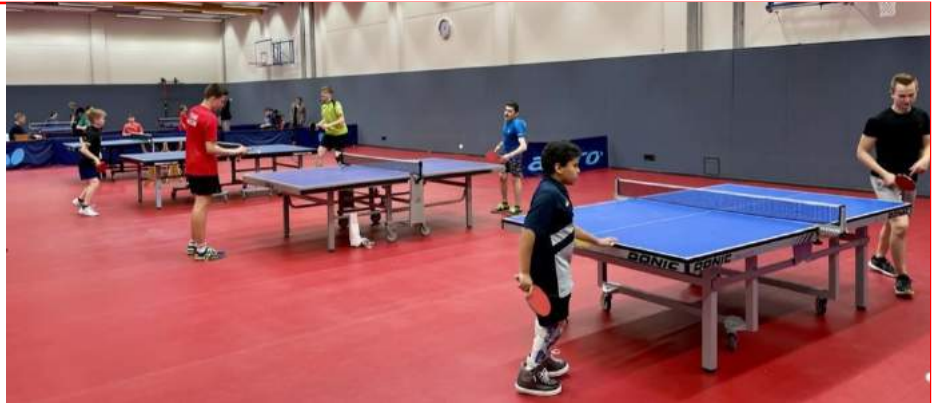
Die 5. Handicap Open