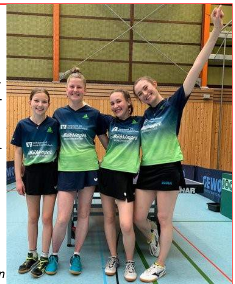
Deutscher Pokalsieger bei den Damen B: Das Team des TTC Mühringen

Alle Ergebnisse finden Sie auf der Homepage .