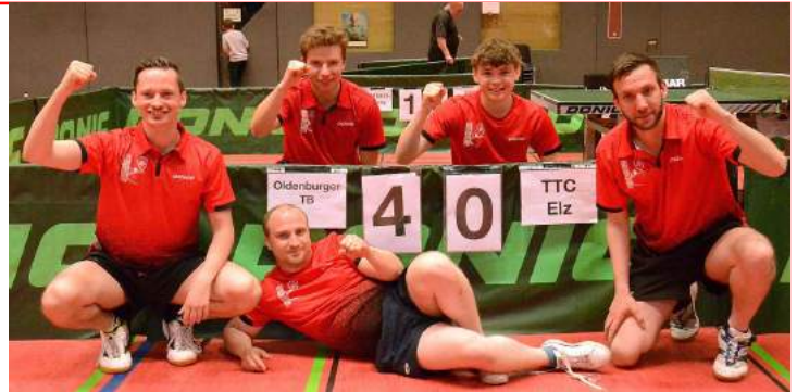
Sieg im A-Finale: der Oldenburger TB