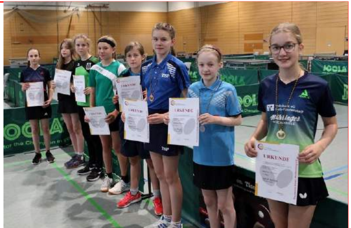
Siegerehrung bei den Mädchen 13

Alle Informationen finden Sie auf unserer Homepage .