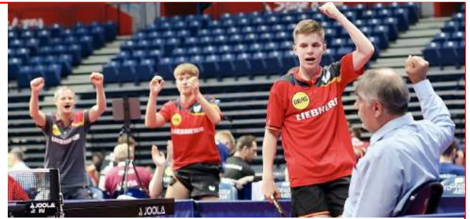
Hochmotiviert, das deutsche U15-Team

Für die Nachwuchs-Nationalmannschaften des DTTB hat der Teamwettbewerb der 64. Jugend-Europameisterschaften in Belgrad mit vier Siegen und vier Niederlagen begonnen. Die U19-Auswahl der Mädchen war am Eröffnungstag trotz einer knappen Partie nicht zu bezwingen und marschiert schnurstracks auf das Achtelfinale zu. Die U15-Teams beider Geschlechter, die jeweils einen Sieg und eine Niederlage verbuchten, können im Falle eines Erfolgs im dritten Gruppenspiel am Donnerstag ebenfalls direkten Kurs auf die Runde der besten 16 nehmen. Das noch sieglose U19-Quintett steht nach einer nicht eingeplanten Niederlage gegen Schweden zwar nun unter Zugzwang, hat nach einem überraschenden Sieg der Schweiz über Schweden aber sogar noch die Chance auf Platz 2 und die Direktqualifikation.