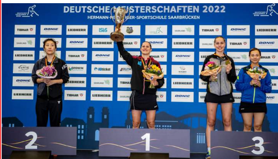
Foto-Nachlese: Deutsche Einzelmeisterschaften Damen/Herren in Saarbrücken