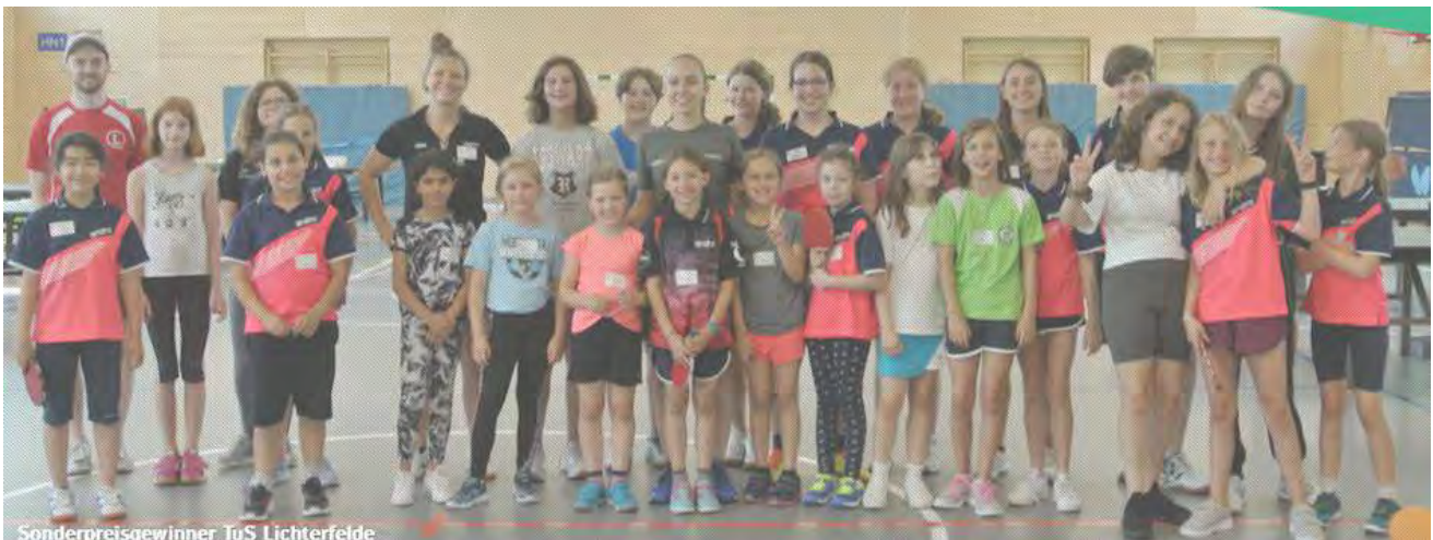
Sonderpreisgewinner TuS Lichterfelde