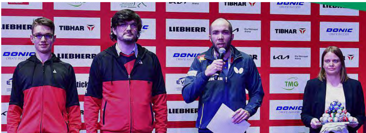
Ehrung für die sechs Breitensportvereine, vertreten durch zwei Repräsentanten des TTC Langen.