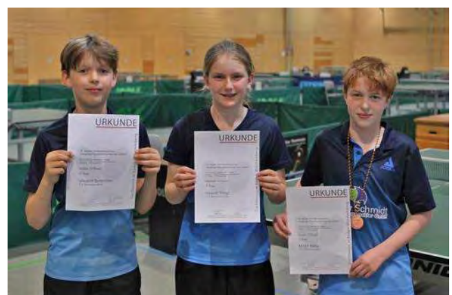
Die Spieler/innen des Gastgebers TTV Weinheim-West

Den gesamten Artikel von Thomas Holzapfel finden Sie hier .