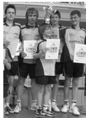
TGV E. Beilstein