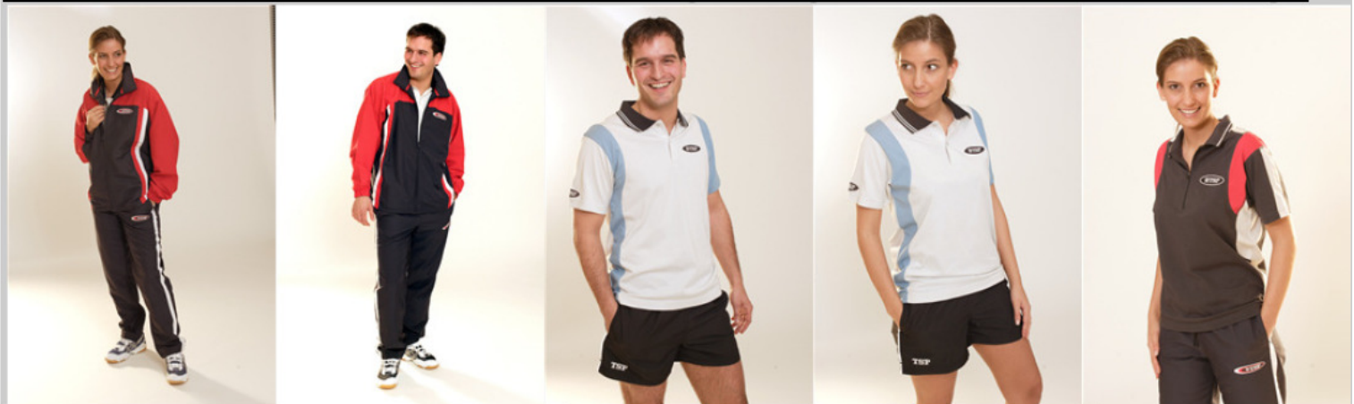
TSP Trainingsanzug ETNA