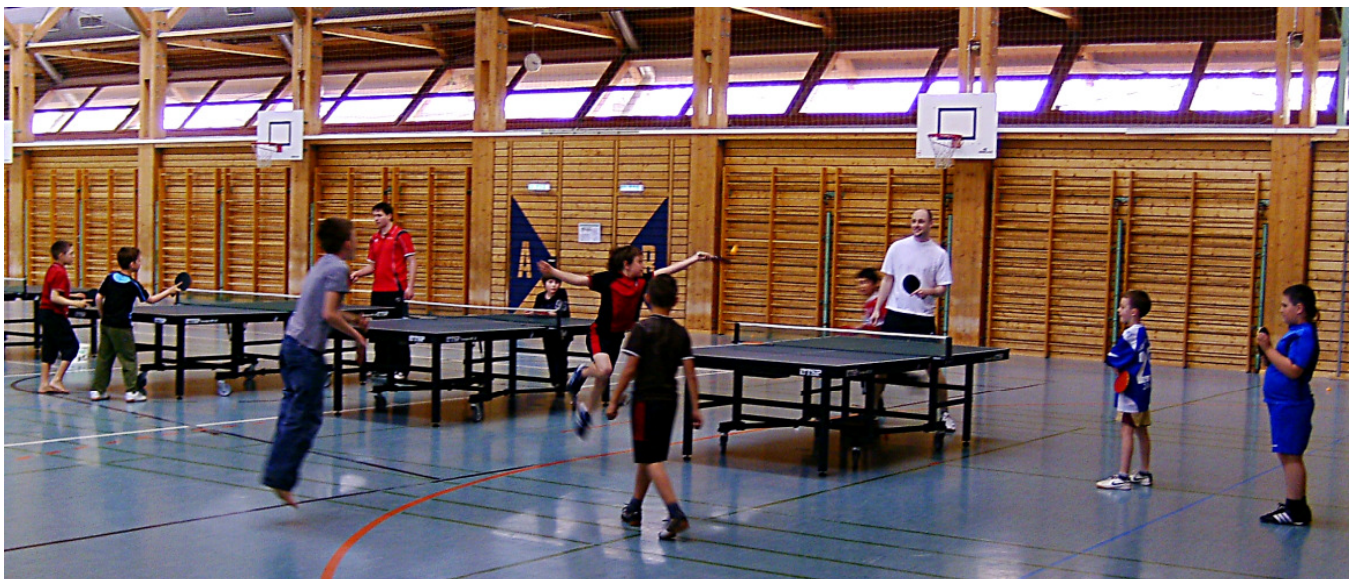
So viel Spaß kann Tischtennis in der Schule machen

Wenn Tischtennis-Vereine die Schulsport-Initiative als Chance begreifen und aktiv auf die Schulen zugehen, bietet „Tischtennis macht Schule“ in den kommenden drei Jahren also wertvolle Chancen und neue Möglichkeiten für Tischtennis-Vereine in Baden-Württemberg.