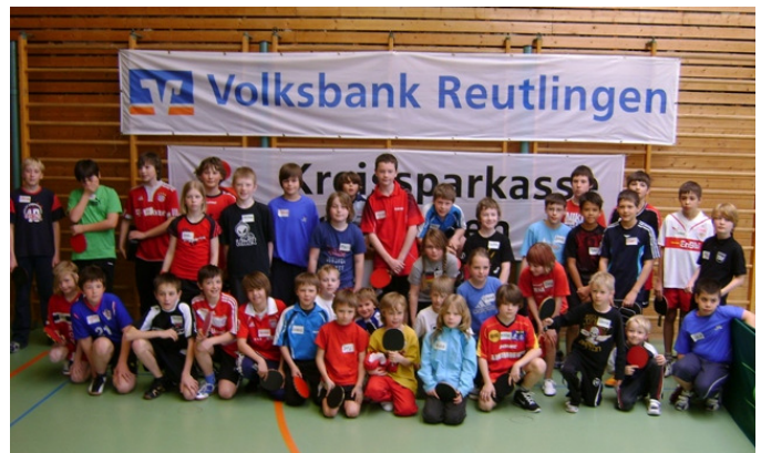
Zum Gruppenfoto versammelt: Die Kinder des mini-Turniers

Fast unermüdlich pendelten die Kinder zwischen Turnierbetrieb und Ballroboter, Tischtennis-Biathlon, Torwand und Co. hin und her. Kräfte sparen lag nicht gerade hoch im Kurs bei den aus dem gesamten Bezirk Schwarzwald angereisten „minis“. Doch mit der Hilfe zweier Helfer aus der Jugendabteilung des TSV ließ sich der Ansturm der spielfreudigen Kinder gut bewältigen. Auch das Turnier selbst glänzte mit ausreichend Helfern und einem gut organisierten Ablauf. Lediglich die Stimmbänder der ohne Mikrofon bestückten Turnierleitung wurden etwas in Mitleidenschaft gezogen.