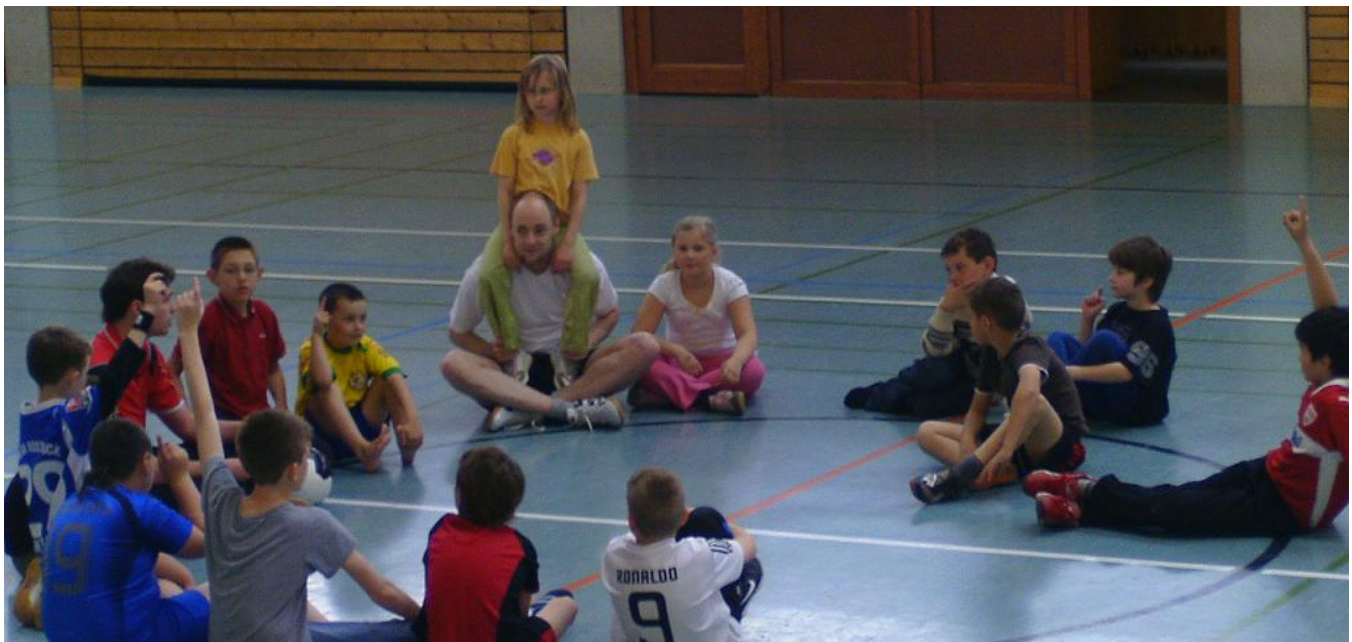
Beim wöchentlichen Begrüßungsritual in der Hallenmitte: Man spricht über die kommenden 90 Minuten

und ist nun seit zwei Jahren fest in den Ganztagesbetrieb integriert. Die Motive für beide Kooperationspartner liegen auf der Hand. Während die AG für die Schule eine willkommene Angebotsvariation in der Ganztagesbetreuung darstellt, will die SG Schorndorf aus der AG neue Nachwuchsspieler gewinnen. Die hierfür notwendige Anschlussmöglichkeit zum Vereinstraining, sowie Einsatzbereitschaft der Mitglieder leistet der Verein exemplarisch. Zur Unterstützung steht immer ein Vertreter