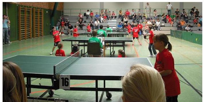
Bereits beim Verbandsentscheid 2009 war einiges los.

Am kommenden Samstag, den 8. Mai 2010 kommt es in Mittelstadt im Verbandsentscheid der mini-Meisterschaften. Dieses Jahr nahmen insgesamt 3116 Kinder an 134 Ortsentscheiden im TTVWH-Gebiet teil. Im Vergleich zur Vorjahresteilnehmerzahl von 1993 entspricht dies einem Plus von 56 %. Eine gewaltige Steigerung. Die besten dieser Kinder, also die besten aus Orts und Bezirksentscheiden kämpfen nun am Wochenende um die Qualifikation für den Bundesentscheid.