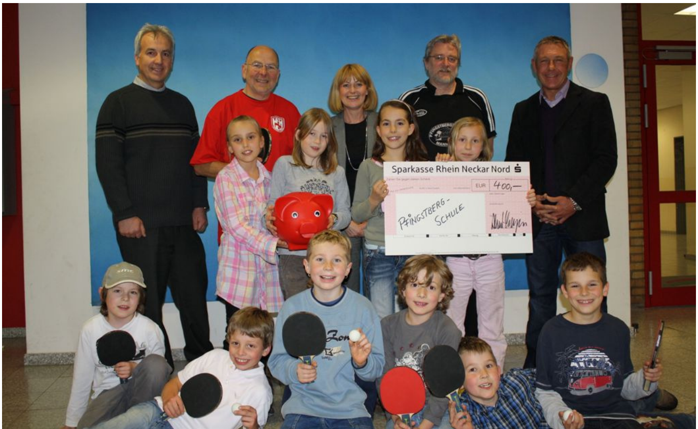
Tischtennisbegeisterte Kinder und Partner, die an der Pfingstbergschule an einem Strang ziehen.

Die Pfingstbergschule zeigt sich als ein gelungenes Beispiel, wie auch örtliche Tischtennisvereine in die Schulsport-Initiative eingebunden werden können. So wurde bereits für die Bewerbung der Kontakt zum ortsansässigen TSV Neckarau gesucht und gefunden. Durch die intensive und aktive Einbindung wird es dem TSV Neckarau auch über die Förderlaufzeit von einem Schuljahr hinaus möglich sein, direkten Kontakt zu talentierten Nachwuchsspielern zu suchen und zu finden. Spezifische Trainingsangebote für Tischtennis-Einsteiger sollen den Weg in den Verein erleichtern und besonders diejenigen ansprechen, die im Rahmen der Schulsport-Initiative den Tischtennissport für sich entdeckt haben.