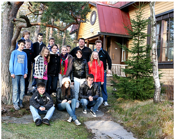
Reisegruppe aus Frickenhausen in Finnland

Beim TTC matec Frickenhausen plant man nun bereits die Ausrichtung einer Internationalen Jugendbegegnung in Frickenhausen für 2011, bei dem es dann mit vielen internationalen Gästen ein großes Einladungsturnier geben soll. Damit werden die im Rahmenprogramm der LIEBHERR EM 2009 geknüpften Freundschaften auch im nächsten Jahr weiter gepflegt.