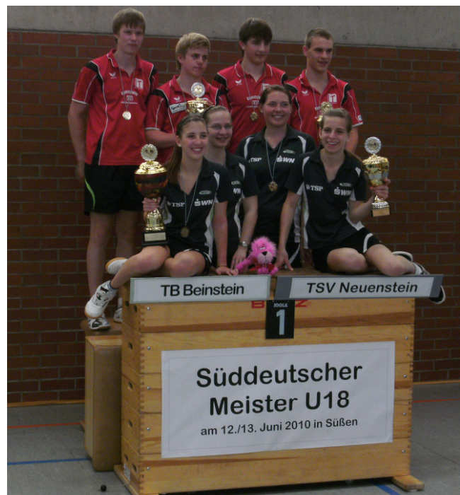
Siegerfoto der siegreichen Teams: TB Beinstein und der TSV Neuenstein

http://ttvwh.de/sueddeutsche-mannschaftsmeisterschaften-der-jugend-am-1213062010-in-scheinfeld-und-suessen-1405_.html