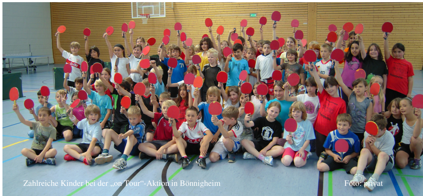
Zahlreiche Kinder bei der „on Tour“-Aktion in Bönningheim

Wendlingen, trainieren. Besonders viel Spaß hatten die Kinder dabei an der „Beckerhecht“-Station, an der es darum geht, mit einem Hecht auf eine Weichbodenmatte einen scharf eingespielten Ball in die VH zurückzuspielen. Am Ende der Stunde durfte sich jedes Kind von Fritz Russek, Abteilungsleiter des TSV, einen Trainingsgutschein und eine Abteilungsbroschüre abholen.