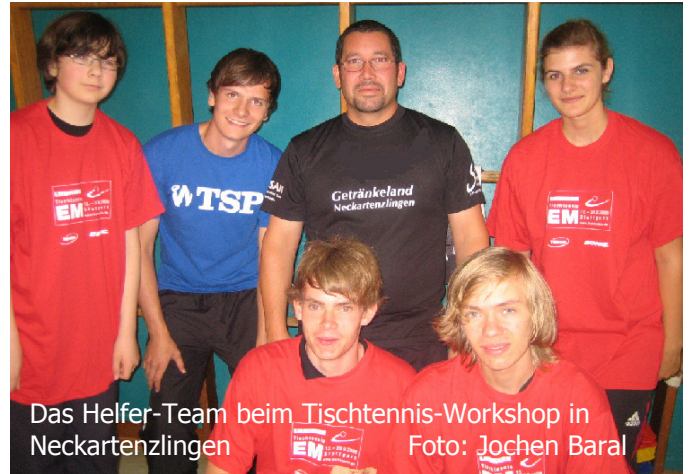
Das Helfer-Team beim Tischtennis-Workshop in Neckartenzlingen

28 Schülerinnen und Schüler nahmen dieses Angebot, das an zwei Projekttagen angeboten wurde, war. Die Schüler der fünften bis zwölften Klasse entwickelten dabei zunächst spielerisch ein Gespür für Schläger und Ball, bevor die exemplarische Einführung des VH-Konters folgte. Nachdem die ersten technischen Voraussetzungen durch Projektleiter Jochen Baral und sein vierköpfiges Helferteam geschaffen wurden, durften die Jugendlichen das Gelernte direkt an den TTVWH-Spielestationen ausprobieren.