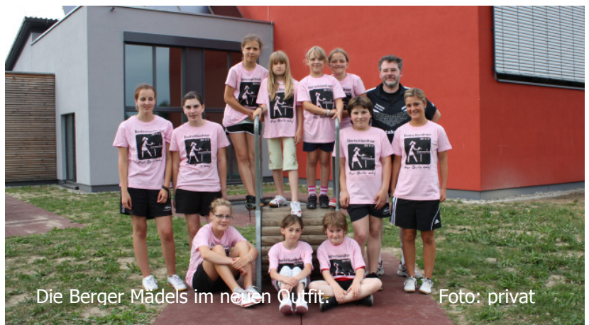
Die Berger Mädels im neuen Outfit.