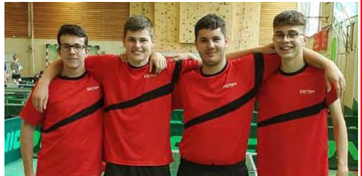
Titelverteidiger GSV Hemmingen