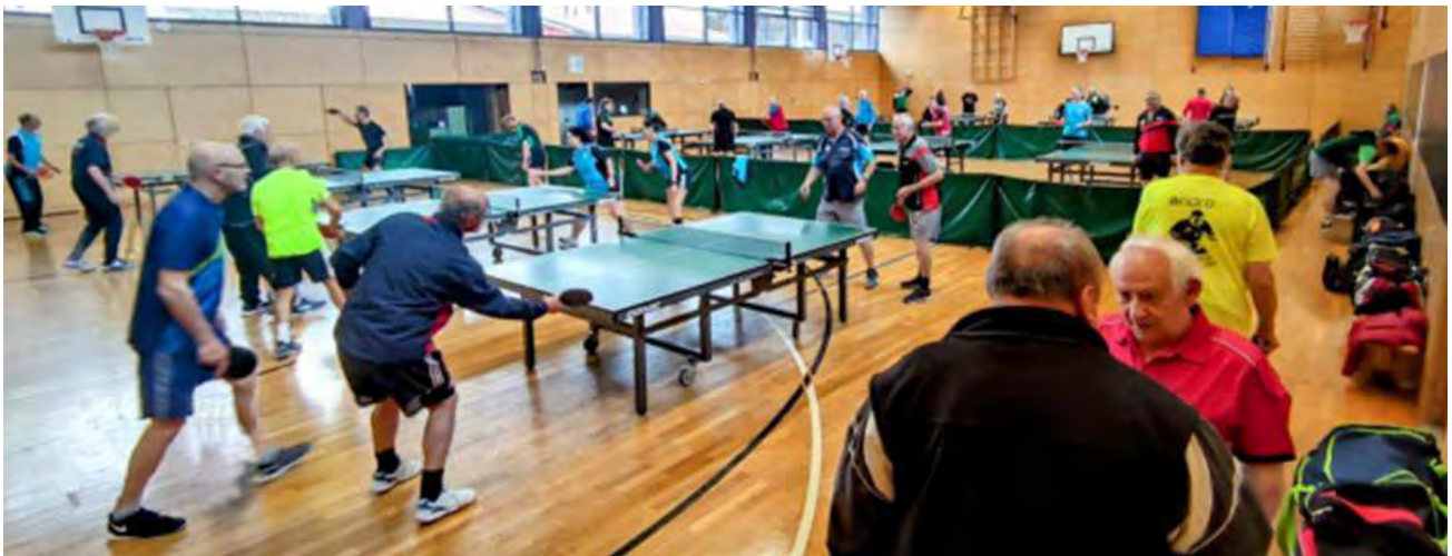
Bericht und Foto: Karl Weber

Proppenvolle Halle am Sonntag in Weissenau: Über 40 teils graue, aber fitte und recht aktive Eminenzen folgten der Einladung des Tischtennisbezirkes Allgäu-Bodensee zum 2. Seniorennachmittag in die Turn- und Festhalle nach Weissenau. Die Tischtennis-Abteilung des SV W stellte die Halle von 15:00 Uhr bis 19:00 Uhr für diese tolle Veranstaltung zur Verfügung und sorgte in der verdienten Pause für den guten Kaffee und den gespendeten Kuchen. Der Nachmittag startete für die über 40 Teilnehmenden mit frei wählbaren Partnern mit den Einzeln. Nach der Pause spielte man bis zum Schluss durch Karten ausgeloste Doppel. Es war schön, dass so viele Tischtennisbegeisterte den Weg in die Halle gefunden haben.