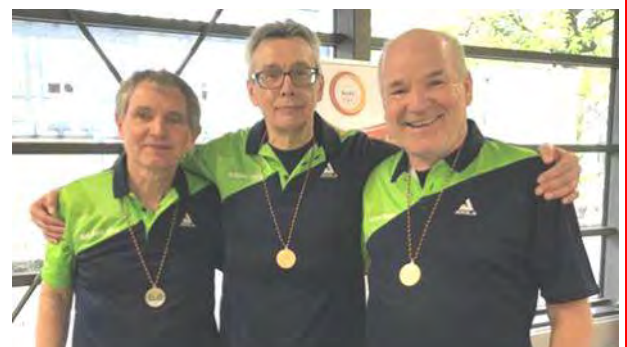
Meister der Senioren 60: TTC Tiengen-Horheim

Am 15. + 16. April 2023 fanden die Offenen Baden-Württembergischen Mannschaftsmeisterschaften der Seniorinnen und Senioren statt. Durchführender Verein war, wie im vergangenen Jahr, der SSV Reutlingen. Am Samstag gingen die Seniorinnen sowie die Senioren 70 an den Start, am Sonntag die Senioren der restlichen Altersklassen. Alle gemeldeten Mannschaften kamen aus TTBW. Die Titelgewinner haben sich für die Deutschen Mannschaftsmeisterschaften am 3./4. Juni 2023 in Schwenningen qualifiziert und bereits ihre Zusage zu dieser Veranstaltung abgegeben. Die Ergebnisse finden Sie hier .