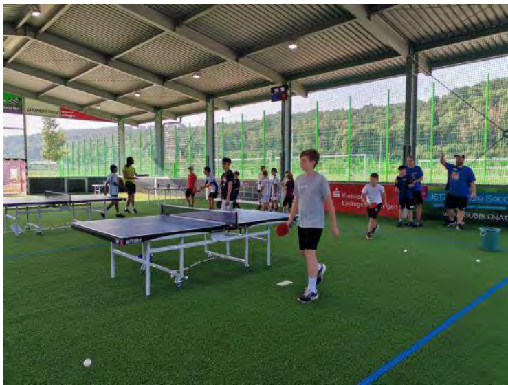
Reges Treiben im Sportpark Weil

Das Spannendste für die Teilnehmer war auf jeden Fall der Roboter, an dem man seine Treffsicherheit ausprobieren konnte. Neben dem Einspielen der Bälle stand unter anderem eine völlig neue Erfahrung im Vordergrund, nämlich Blindentischtennis.