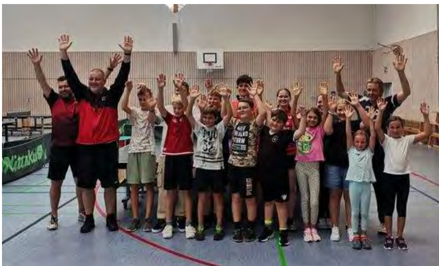
Tolle Stimmung in Oberbrüden

Das Ferienprogramm „Ping-Pong-Party“ am 04.09.2024 beim TSV Oberbrüden war mithilfe einer „TTBW on Tour“-Aktion ein voller Erfolg. Das Ziel: Nachwuchsspieler für den Verein gewinnen. Einen ganzen Nachmittag lang konnten zwölf Kinder austesten, was der Tischtennissport so zu bieten hat. Nach einigen Ballgewöhnungsübungen, wie z.B. das Balancieren des Balls auf dem Schläger, ging es auch schon an die Tische, wobei die Teilnehmer ihr Ballgefühl unter Beweis stellten. Hier war vom individuellen Balleimertraining bis zum Riesentisch alles dabei.