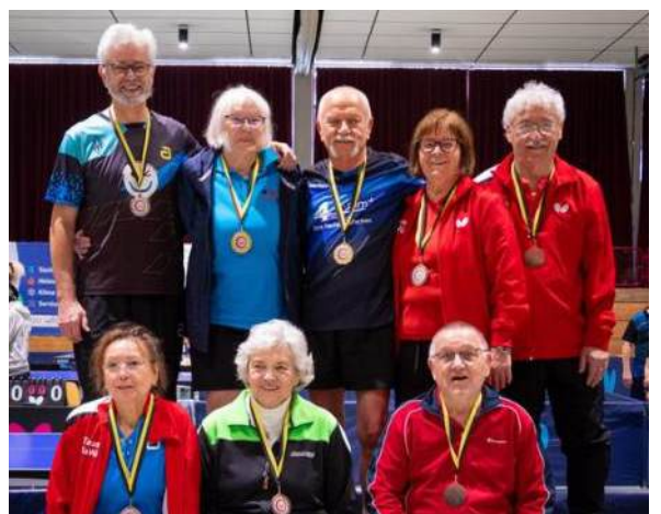
Mixed Senioren 70

Den vollständigen Bericht mit den Ergebnissen finden Sie hier .